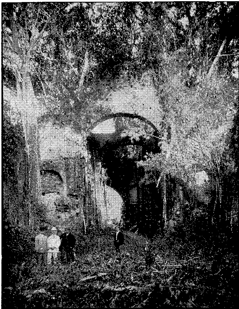
Ruinas de la Iglesia de San José de la antigua ciudad de Panamá (durante la visita de los Delegados.)